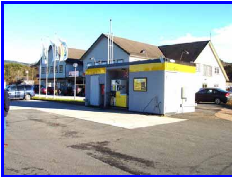
Norge: Helgeland / Sörlandet

Malte FuelTec:s hemsida angående cisternanläggningar, www.malte.se